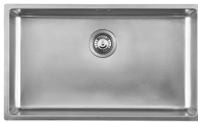
Spülbecken KE - R15 Vintage 2157 080